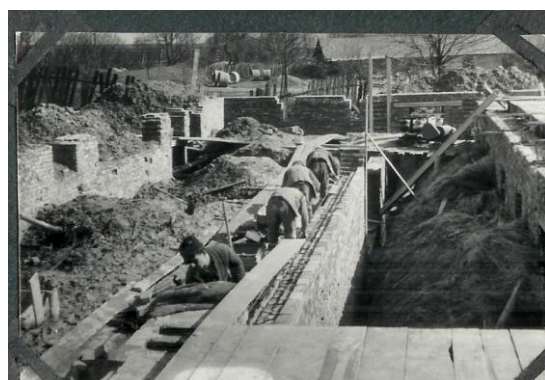
Budowa nowej siedziby szkoły przy ul. Krakowskiej 15.